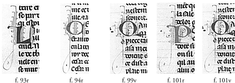
tav. 4. Capilettiera filigranati – mano B

I capilettiera che accompagnano il testo copiato dalla mano A [tav. 3] presentano una filigrana molto più contenuta, che tende ad esaurirsi nella seconda linea di scrittura sottostante all'iniziale: la filigrana si sviluppa, prevalentemente, attraverso il tratteggio di fitte linee interne al capolettiera, talvolta caratterizzate da leggera curvatura; la decorazione esterna all'iniziale, sviluppantesi nel margine esterno della pagina, presenta invece frequenti svolazzi. Le lettrines che compongono la sezione copiata dalla mano B [tav. 4] mostrano invece uno sviluppo diverso: nel corpo della lettera si osserva un'esecuzione degli occhielli tondi, mentre il tratto verticale delle aste esterne è accentuato da un caratteristico occhiello, chiuso e puntato, nel margine inferiore della filigrana (che si estende di norma fino al quarto rigo), così come più marcata è l'estensione del motivo vegetale nella parte superiore dell'asta.