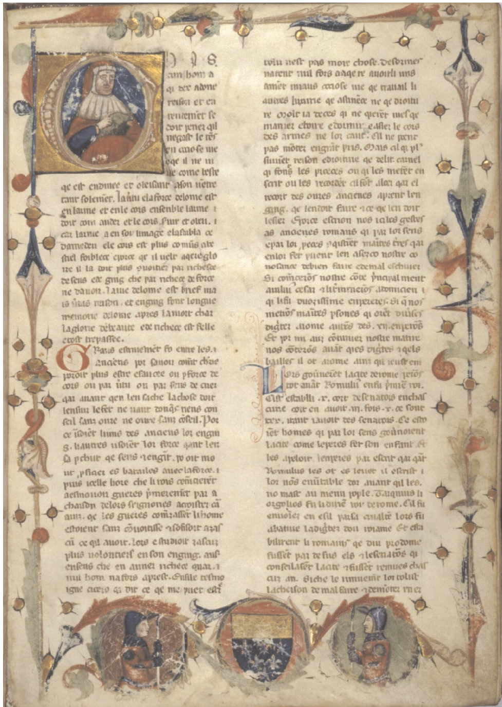
fig. 1. Oxford, Bodleian Library, Canon. Misc. 450, c. 1r.